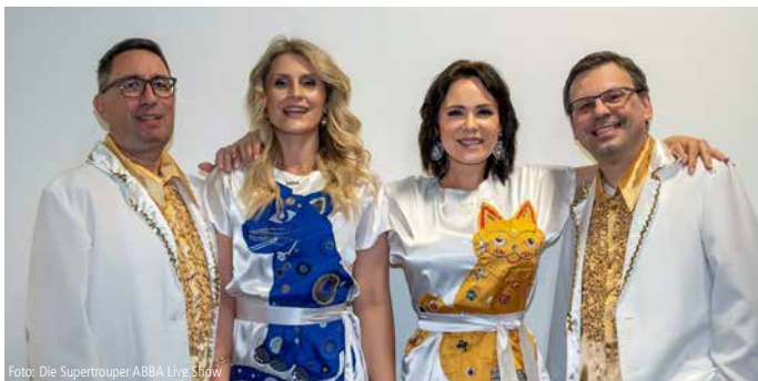
Foto: Die Supertrouper ABBA Live Show

Die Supertrouper ABBA Live Show | Fürstenfeld | Stadthalle | 19:30 Uhr | 50 Jahre Waterloo Tour 2024. | Weitere Infos: www.media-con.at