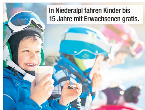
In Niederealpl fahren Kinder bis 15 Jahre mit Erwachsenen gratis.

Piste für Riesentorlauf- und Slalom-Bewerbe. Kulinarik-Tipp: Einkehren kann man in der „Schrimpf Stub'n“, die für den besten Schweinsbraten bekannt ist, oder im „Gamserl“, wo es steirische Spezialitäten gibt. Infos: hochsteiermark.at und schwabenbergarena.at